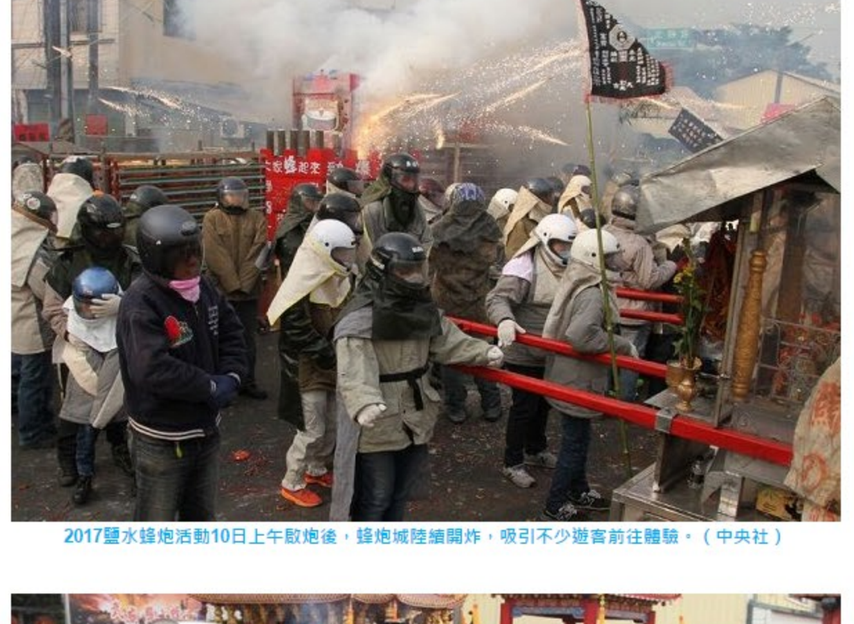
2017鹽水蜂炮活動10日上午啟炮後，蜂炮城陸續開炸，吸引不少遊客前往體驗。

民政局表示，「鹽水蜂炮APP」不只讓遊客掌握神轎遶境現況，也讓不想參與的民眾避免陷入遶境隊伍。