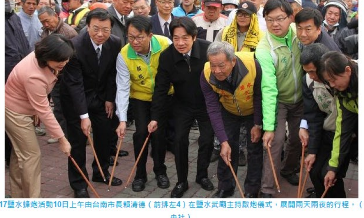
2017鹽水蜂炮活動10日上午由台南市長賴清德(前排左4)在鹽水武廟主持啟炮儀式，展開兩天兩夜的行程。(中央社)